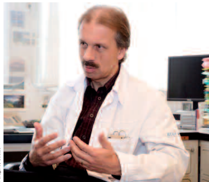
Spécialiste de la maladie de Parkinson, le Pr Pierre Burkhard souligne l'importance cruciale des fonds privés pour la recherche.

15 rue de la Confédération – 1211 Genève 1 tél. 022 817 07 70 – fax 022 817 07 70 carine.brunetti@kritter.ch