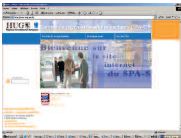
Le site Internet du service de psychiatrie adulte-secteurs est disponible à l'adresse http://spas.hug-ge.ch .